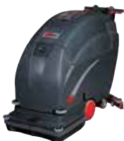
FANG24T / 26T / 28T